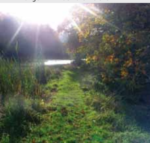
Blick auf Muschenheim.